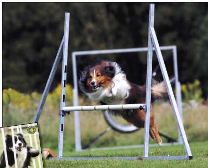
Hoppinderstöden får inte längre sitta ihop nedtill. Det nya regelfärdet går att beställa från Svenska Brukshundklubben.

Det är ingen nyhet att agilityreglerna förändras vid årsskiftet. Regelrevideringen har pågått under flera år. Men först nu är det klart hur reglerna kommer att se ut och hur de ska tolkas, under de kommande fem åren. TEXT: MARI EDMAN.